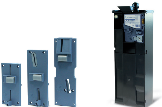
Placas frontales: mod. F1 (60x118 mm) - F3 (60x152 mm) - F6 (60x180 mm)